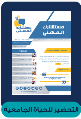
العدد السابع - يوليو ٢٠٢١