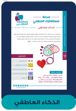
العدد العاشر - نوفمبر ٢٠٢١