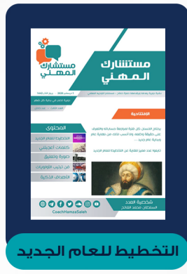
العدد الثالث - ديسمبر ٢٠٢٠