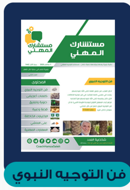
العدد الثاني - نوفمبر ٢٠٢٠