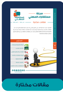
العدد التاسع - أكتوبر ٢٠٢١