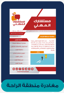
العدد السادس - مارس ٢٠٢٠