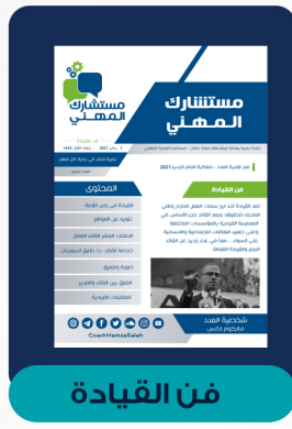
العدد الرابع - يناير ٢٠٢١