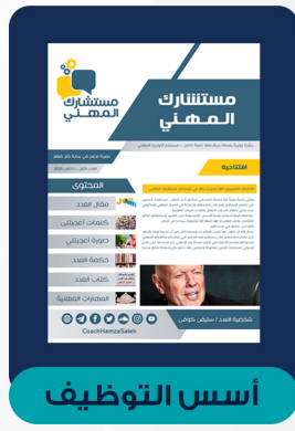
العدد الأول - أكتوبر ٢٠٢٠