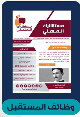
العدد الخامس - فبراير ٢٠٢١

منطلقنا فيها إيماننا بقدرة الإنسان الهائلة على التغيير والتطور نحو الأفضل واستحقاقه أعظم مقام في الكون؛ وهو خلافة الله في الأرض. مع طريقة عرض مميزة تتنوع بين السرد المعرفي، والصورة المعبرة، والمسابقة الهادفة، والحكمة المختارة، والانفوجراف الشيق، مع أهم المقالات العلمية في مجال الإدارة والتطوير المهني.