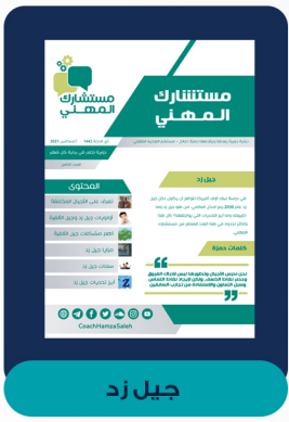
العدد الثامن - أغسطس ٢٠٢١